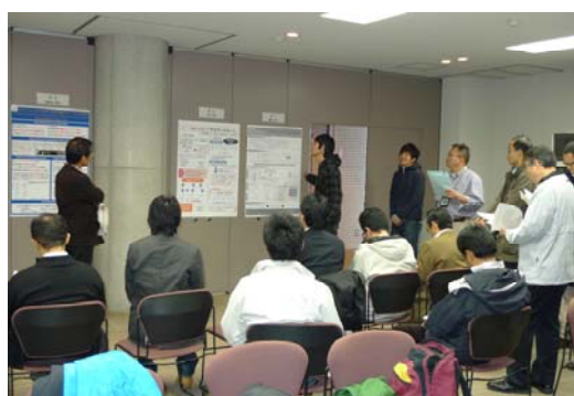
ポスター前での発表状況